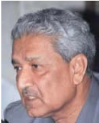
Abdul Qadeer Khan