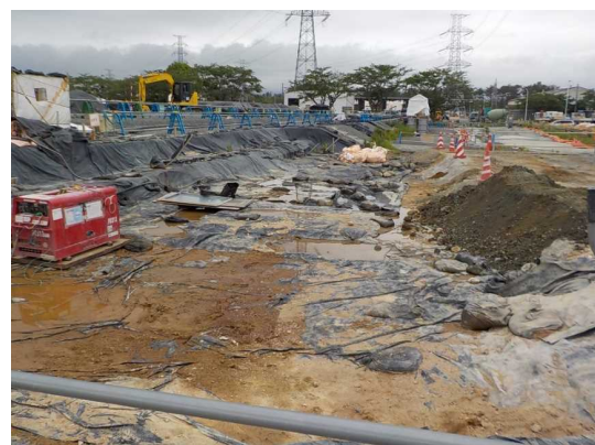
掘削終了時の状況