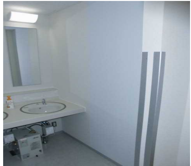
トイレ手洗い場（改修後）