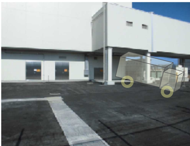
従来の搬入イメージ

コンテナ搬入口については、仮措置として現在の搬入口にプレハブを設置しドックシェルターを付設（①）。その後、本設のドックシェルターを設置（②）