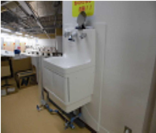
西側壁面に手洗い場新設