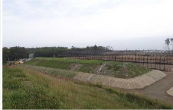
覆土式一時保管施設