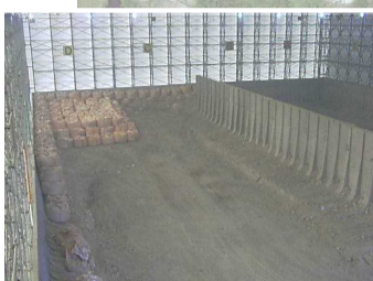
瓦礫保管 テント内