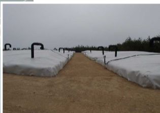
伐採木一時保管槽