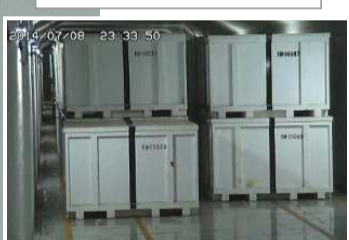
固体廃棄物貯蔵庫