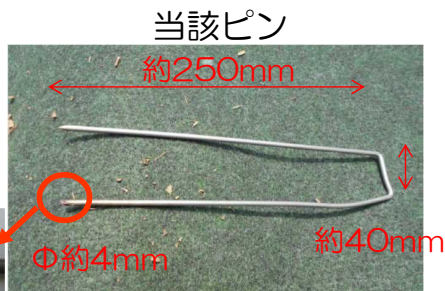
事象発生箇所の状況