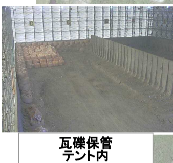
瓦礫保管 テント内