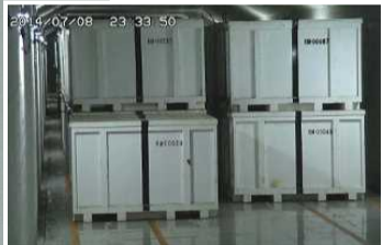
固体廃棄物貯蔵庫