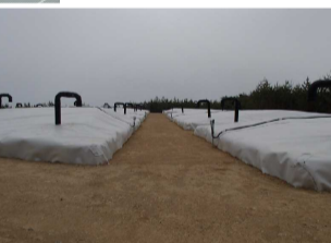
伐採木一時保管槽