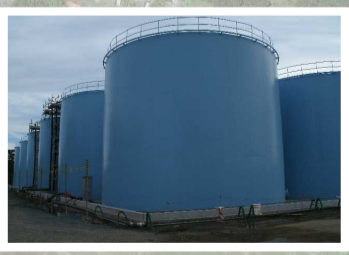
タンクの設置状況