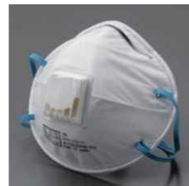
使い捨て式防じんマスク