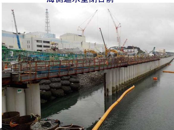
海側遮水壁閉合前