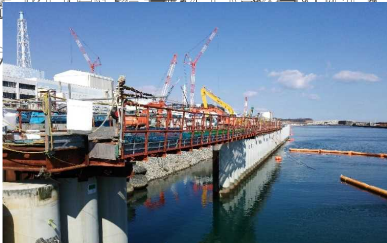
海側遮水壁閉合箇所 : 鋼管矢板9本分(延長約10m)