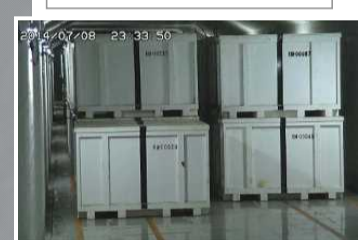
固体廃棄物貯蔵庫