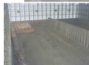
瓦礫保管 テント内