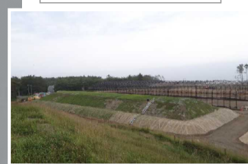
覆土式一時保管施設