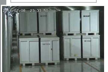
固体廃棄物貯蔵庫