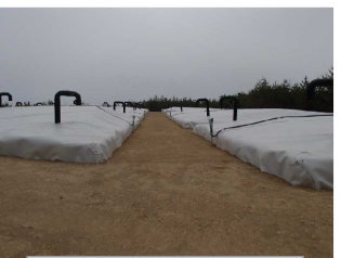
伐採木一時保管槽