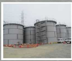
タンクの設置状況