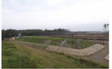
覆土式一時保管施設