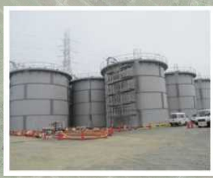
タンクの設置状況