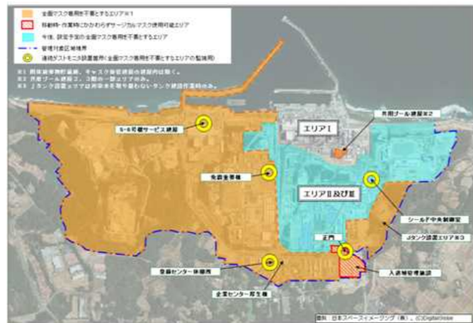
全面マスク着用を不要とするエリア