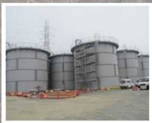
タンクの設置状況