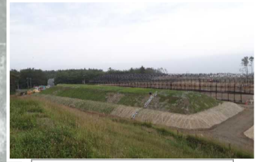
覆土式一時保管施設