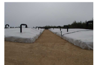
伐採木一時保管槽