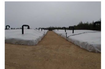
伐採木一時保管槽