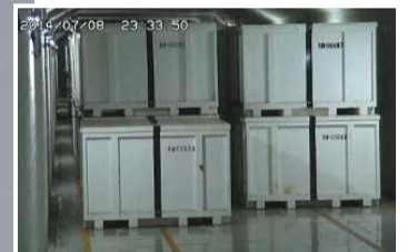
固体廃棄物貯蔵庫