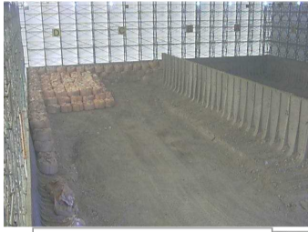
瓦礫保管 テント内