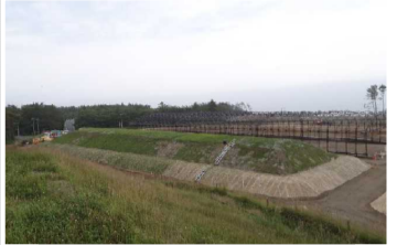
覆土式一時保管施設