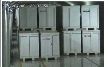
固体廃棄物貯蔵庫