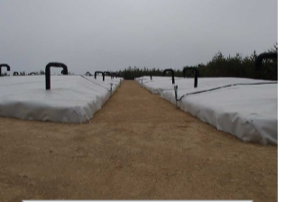
伐採木一時保管槽