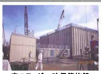
廃スラッジ一時保管施設