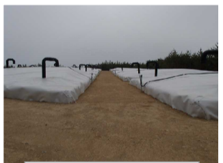
伐採木一時保管槽