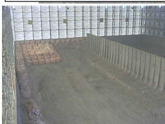
瓦礫保管 テント内