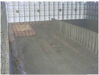
瓦礫保管 テント内