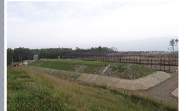
覆土式一時保管施設