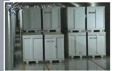
固体廃棄物貯蔵庫