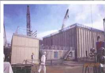
廃スラッジ一時保管施設