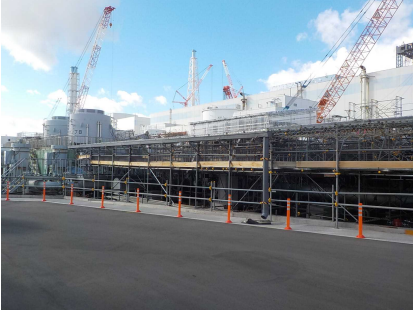
サブドレン移送ポンプ建屋周辺