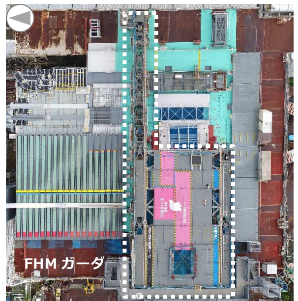
3号機原子炉建屋オペフロ全景 (4月21日時点)