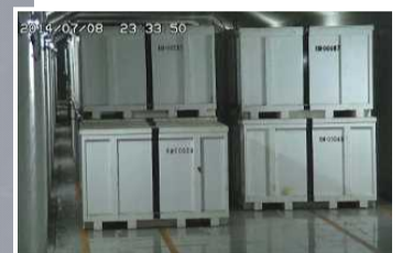
固体廃棄物貯蔵庫