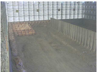
瓦礫保管 テント内