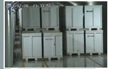
固体廃棄物貯蔵庫