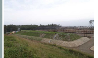
覆土式一時保管施設