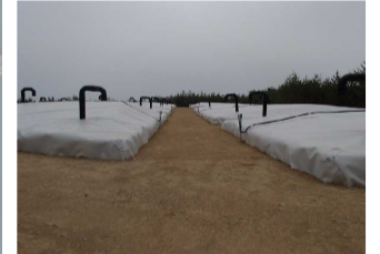
伐採木一時保管槽