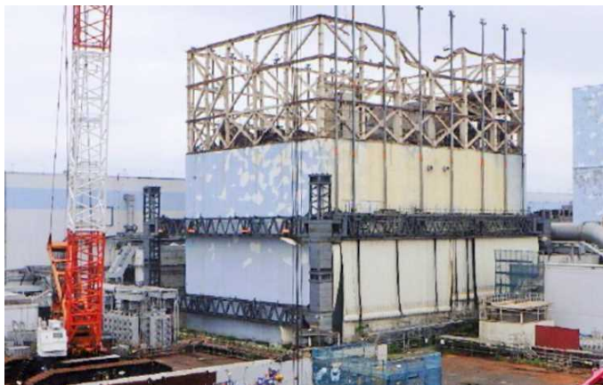
取付け前 (2017年6月19日撮影)