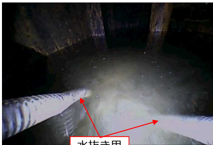
水抜き用のホース