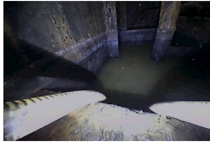
復水器H/W天板下部の水抜き作業 (移送中)