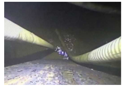
復水器H/W天板下部の水抜き作業 (移送後)