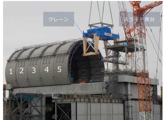
3号機原子炉建屋オペフロ全景 (11月20日時点)