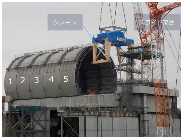
3号機原子炉建屋オペフロ全景 (11月20日時点)