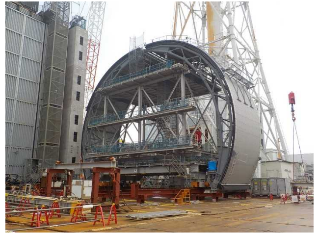
3号機原子炉建屋西側ドーム6地組