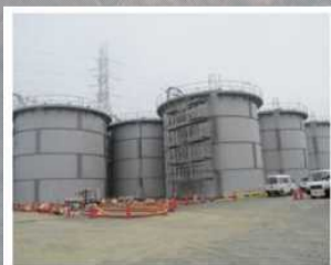
タンクの設置状況