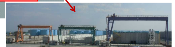
使用済吸着塔一時保管施設