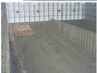
瓦礫保管 テント内