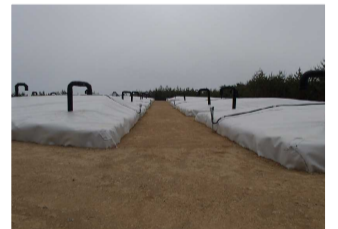
伐採木一時保管槽