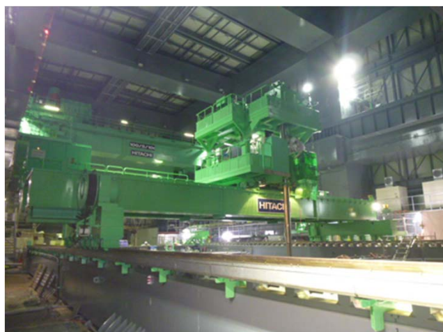
【4号機の燃料取り出し用カバー内部】

現在:2013年11月18日より、 第1期の目標である4号機使用済み燃料プールからの燃料取り出しを開始