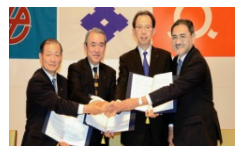
立地基本協定締結式