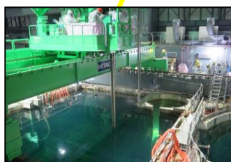
使用済燃料プールからの燃料取り出し