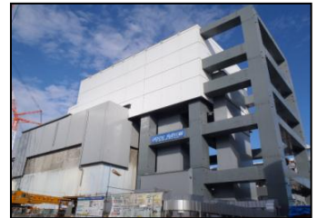
燃料取り出し用カバー完成