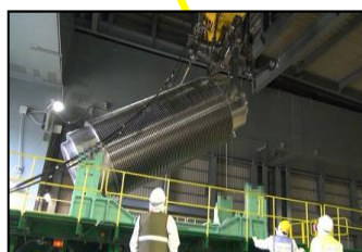
トレーラーへのキャスク積み込み