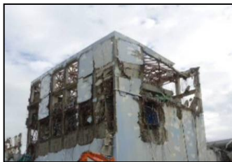
原子炉建屋ガレキ撤去作業前