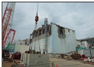
原子炉建屋ガレキ撤去作業後