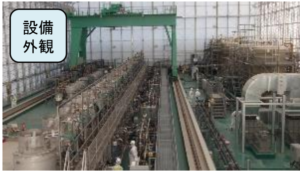
高性能多核種除去設備