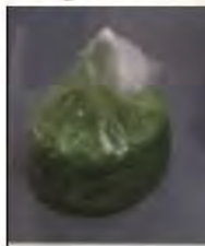
商品をミキシング