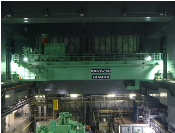
①天井クレーン全体（オペレーティングフロア北側より撮影）