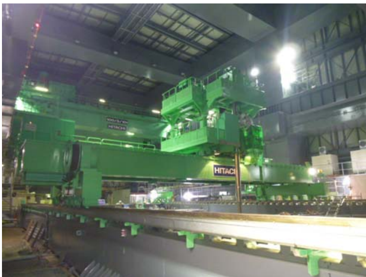
③燃料取扱機全体（オペレーティングフロア北側より撮影）