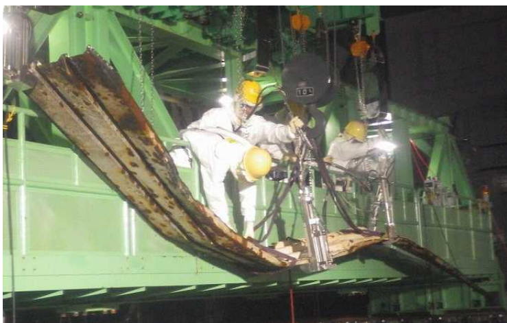
①原子炉ウェル内瓦礫（デッキプレート）