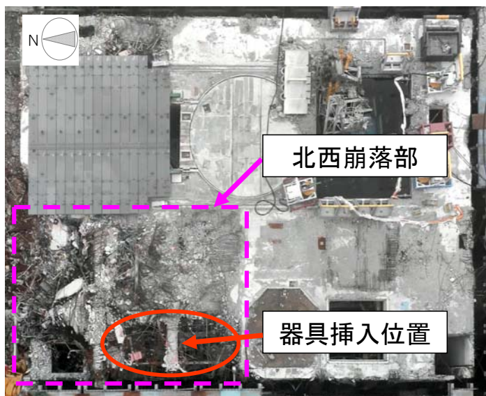
図1 オペレーティングフロア現状 (H26/5時点)