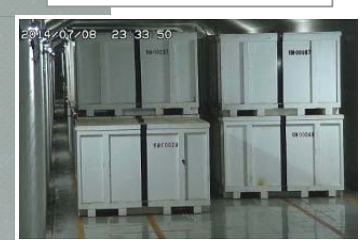
固体廃棄物貯蔵庫