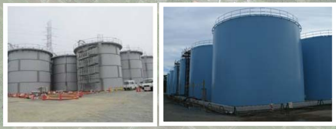
タンクの設置状況