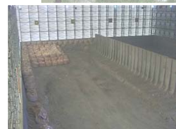
瓦礫保管 テント内