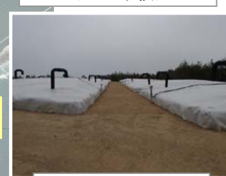
伐採木一時保管槽