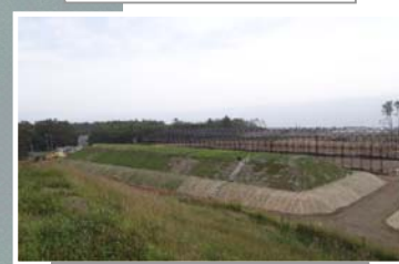
覆土式一時保管施設