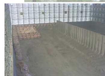
瓦礫保管 テント内