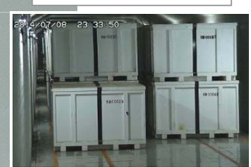
固体廃棄物貯蔵庫