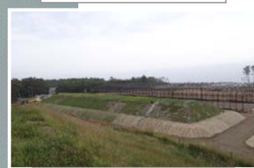
覆土式一時保管施設