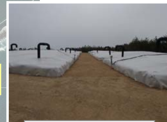
伐採木一時保管槽