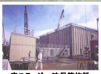
廃スラッジ一時保管施設