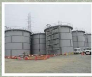
タンクの設置状況