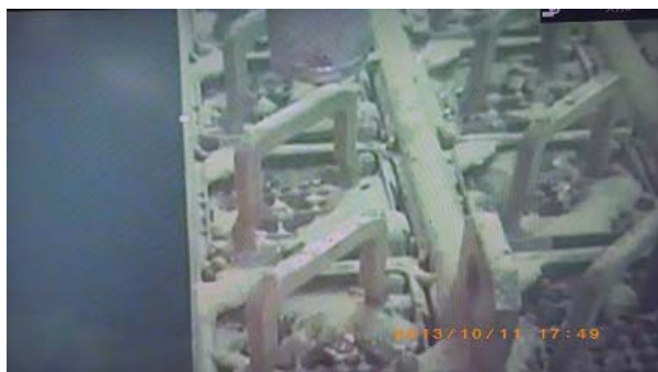
①ガレキ吸引作業前