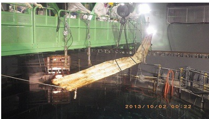
④使用済燃料プール内ガレキ(デッキプレート)