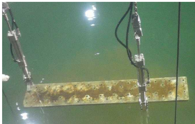
②使用済燃料プール内ガレキ(足場板)