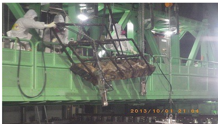
③使用済燃料プール内ガレキ(作業台車用階段)