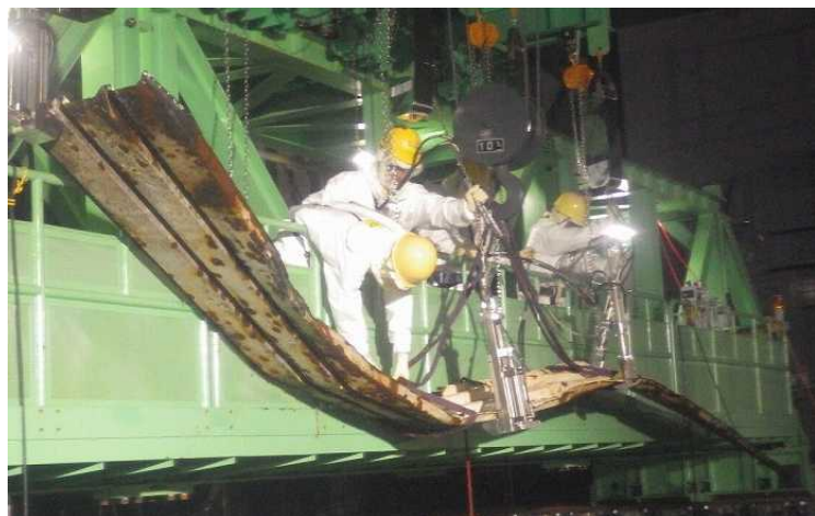
①原子炉ウェル内ガレキ(デッキプレート)