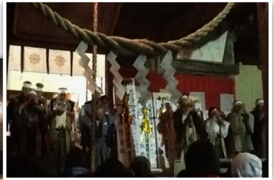
◆南相馬市 相馬太田神社◆