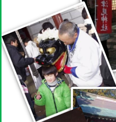
◆田村市 大鐮矢神社◆