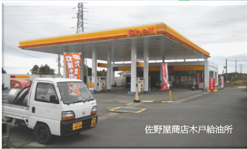
佐野屋商店木戸給油所

環境省、地元企業、前田JVより、「8月には営業再開しないのか」との多くの方から再開を願うお話をいただいたので、