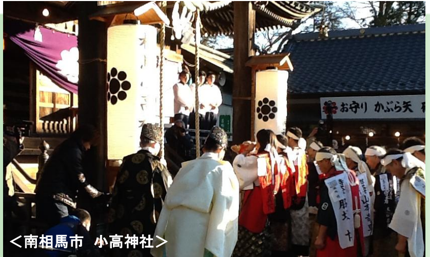
<南相馬市 小高神社>

避難指示区域の 年末年始宿泊を 実施しました。 574人 171世帯が、 我が家にて年越し