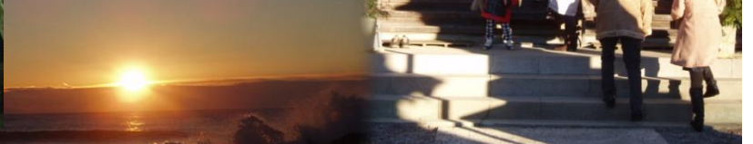
◆広野町 檜葉八幡神社◆