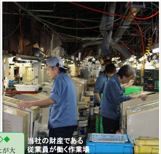
当社の財産である 従業員が働く作業場

事業環境における課題はまだ多いですが、当社の技術の要である従業員のため、飯館村のために今後も事業を継続し続けると共に、一刻も早い住民の帰還や生活環境の整備にも雇用などの観点から貢献していきたいと思えます。従業員一人ひとりのへの支援がひいては福島県民への支援、福島の復興への貢献になるものであると信じています。