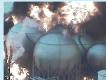
【東日本大震災時に発生した大規模火災の様子】