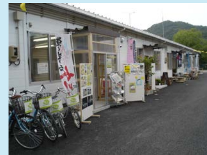
中小機構が建てた仮施設設事例