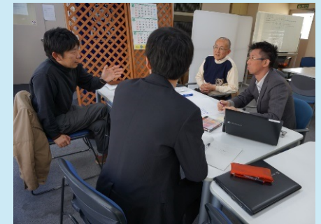
企業に対する個別指導