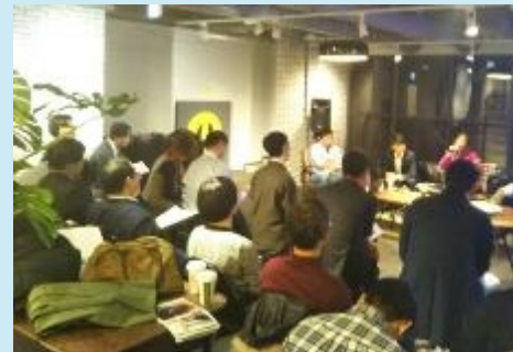
首都圏におけるPRイベント