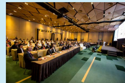
世界ゴムサミットの様子