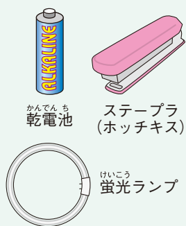
乾電池 ステープラ (ホッチキス)