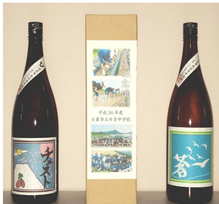
ラベルを貼った瓶と化粧箱