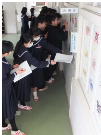
美術の授業での制作と ラベル鑑賞会の様子