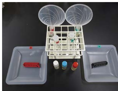
▲オリジナル実験キット