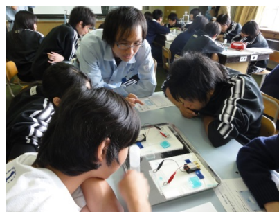
▲ イオンの移動の様子を観察実験