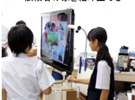
▲グループで作った家をプレゼンテーション