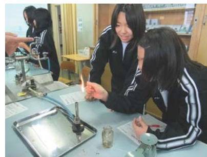
▲ 燃焼実験でプラスチックの性質を調べる