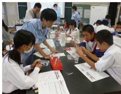
▲サポーターとともに消化酵素の働きを実験で確認

理科学習と医療のつながり からだのしくみを利用して検査薬と装置の研究開発を行っていることを伝える