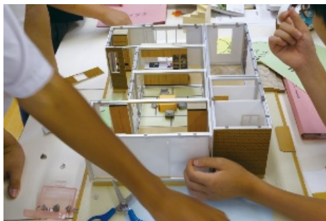
▲住宅キットを用い、依頼者の家を組み立てる