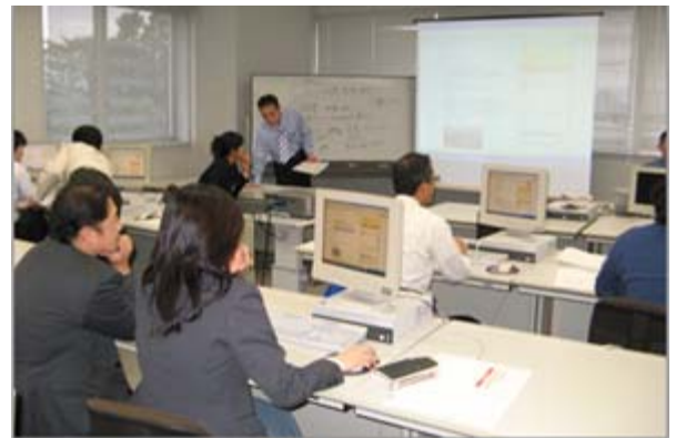
↑「いしかわ元気企業ナビ」掲載支援講座風景