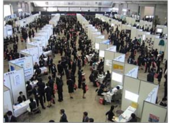
↑「ふるさと就職フェア2007」

いしかわ元気企業ナビに掲載情報をそのまま印刷し、参加企業情報誌に。企業の理解促進のための事前資料として活用。