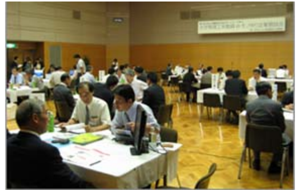
↑「理系教員×モノづくり企業懇談会」