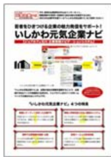
(左)若者向け (右)企業向け