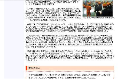
若者の感想を まとめた 「企業見学 レビュー」→