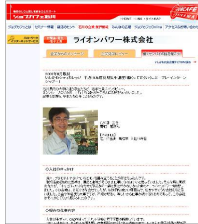
←学生取材記事 「働くセンパイの話を聞こう！」

若者を意識した情報提供の内容、写真の選び方、WEBならではの文章作成など、企業の魅力を十分に発信するためのポイントを講義と実践を交えて少人数制で決め細やかに指導。