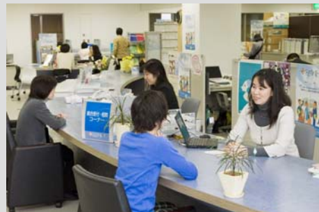
京都ジョブパーク・総合相談窓口

これこそが我々スタッフの一番の誇りであり、今後とも一人ひとりのニーズにあった、きめ細かな支援を続けていきたい。