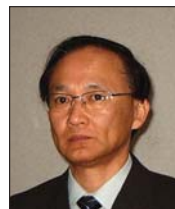
プロジェクト実施者 松下電器産業(株) 松下ホームアプライアンス社 冷熱空調研究所 材料開発グループマネージャー