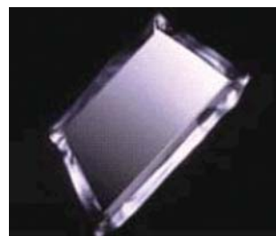
高性能真空断熱材『U-Vacua』