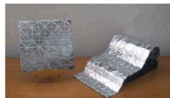
高機能真空断熱材『Chip-Vacua』