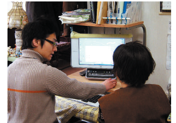
家まで出張プランの様子

「パソコンブックス解消大作戦」は、大学生と地域住民と商店街の垣根を下げるため、商店街に客が来ない午後2時から4時に店を借りて実施したが、大学生と生徒さんとお店の空き時間調整が大変になった。そこで地元の研修室を借りて講座を開いた。しかし、3ヶ月コースだと年4回しか開けない。もっと交流を増やすため、「家まで出張プラン」を加えた。基本料4,200円。「お茶を飲む出張サポート」である。お茶を飲む間に「学生さんですね。地元どこなの？」といった会話が生まれ、「そうそう、あの時、こうだったのよ」という質問が出てくる。ところが、講座の卒業生が時間の経過と共にパソコンができなくなるという事がわかった。卒業したら満足してパソコンを使わなくなる事が原因だった。次のテーマは「パソコンに触ってもらうためにはどうすればいいか？」に決まった。